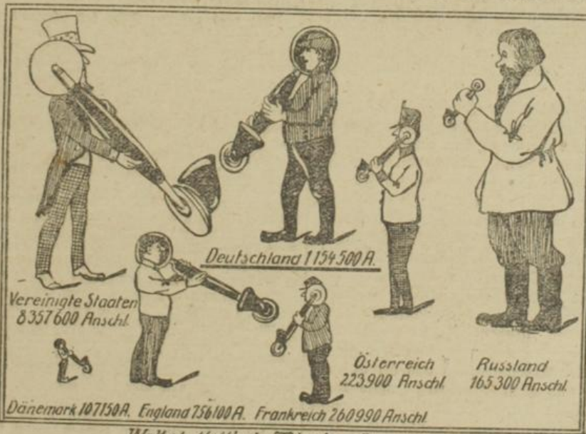
Weltstatistik der Telephon-Anschlüsse

Die Organe der bürgerlichen Parteien haben allerdings den unmittelbaren Zusammenhang hervor, der zwischen Bebels Welttriumph und seiner unermüdbaren Arbeit im Dienste der von ihm geführten Volksmassen bestand. Aber diese Massen selbst, die durch ihre zielbewußte historische Aktivität ihren Führer in den Vordergrund der Geschichte gerückt hat und ihm die Möglichkeit gab, eine der ersten Rollen dort zu spielen, figurieren in den Nekrologen der