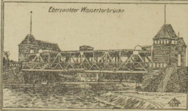
Bilder vom Berlin-Stettiner Großschiffahrtskanal bei Eberswalde.