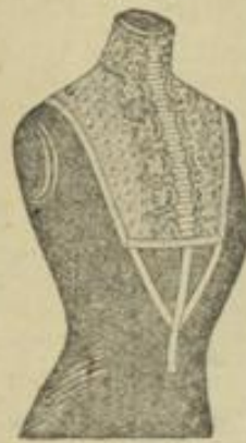
Abb. 4. Passentüll mit Bandschnöpfen zum Befestigen.