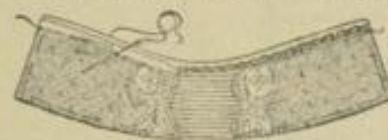
Abb. 5. Stecktragen zum Passentüll.