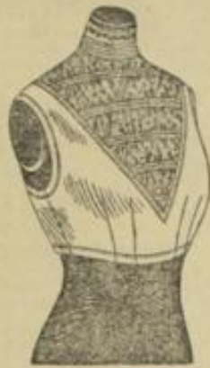
Abb. 1. Gumppe in Form einer Untertaile.