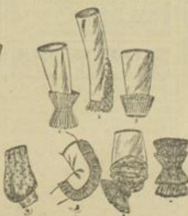
Abb. 7. Verschiedene Ärmel zum Auswechseln.

Briefpapiere, Briefumschläge, Korrespondenzkarten, Siegellacke