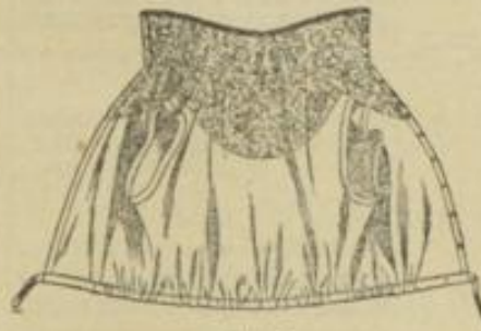
Abb. 3. Gumppe mit Chantillyspitzenpasse.