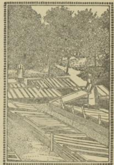
Gärtnerinnen bei der Arbeit an Frühbeeten.

retisch, letzteres von akademisch gebildeten Lehrern, ausgebildet werden. Nach vollendeter Lehrzeit erhalten sie ein Abgangszeugnis, das jedoch keinerlei praktische Berechtigungen hat. Nach einer gründlichen theoretischen und praktischen Ausbildung bemühen sich die meisten, als Volontärin in handelsgärtnerischen, auf Obstgütern oder als Hospitantin an einer der genannten Gärtnerischen Schulen sich weiter zu vervollkommen, denn nur gründlich vorgebildete Frauen finden ihr gutes Sortkommen als Gärtnerinnen in Sanatorien, auf Gütern, in Haushaltungsschulen, handelsgärtnerischen und den verschiedensten Erziehungsanstalten, die im Interesse ihrer Schüler die Bebauung des Gartens in ihre Lehrpläne aufgenommen haben.