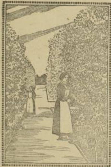
Gärtnerinnen beim Obstgärteln.