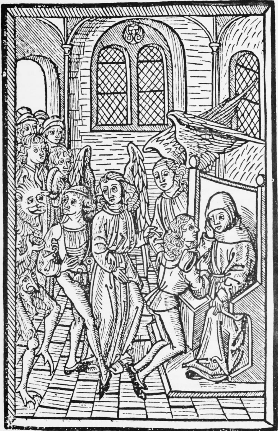
Holzschnitt aus : Beichtbüchlein (Leipz.) Kachelofen (um 1495). (-Nr. 153. Bl. 1b)