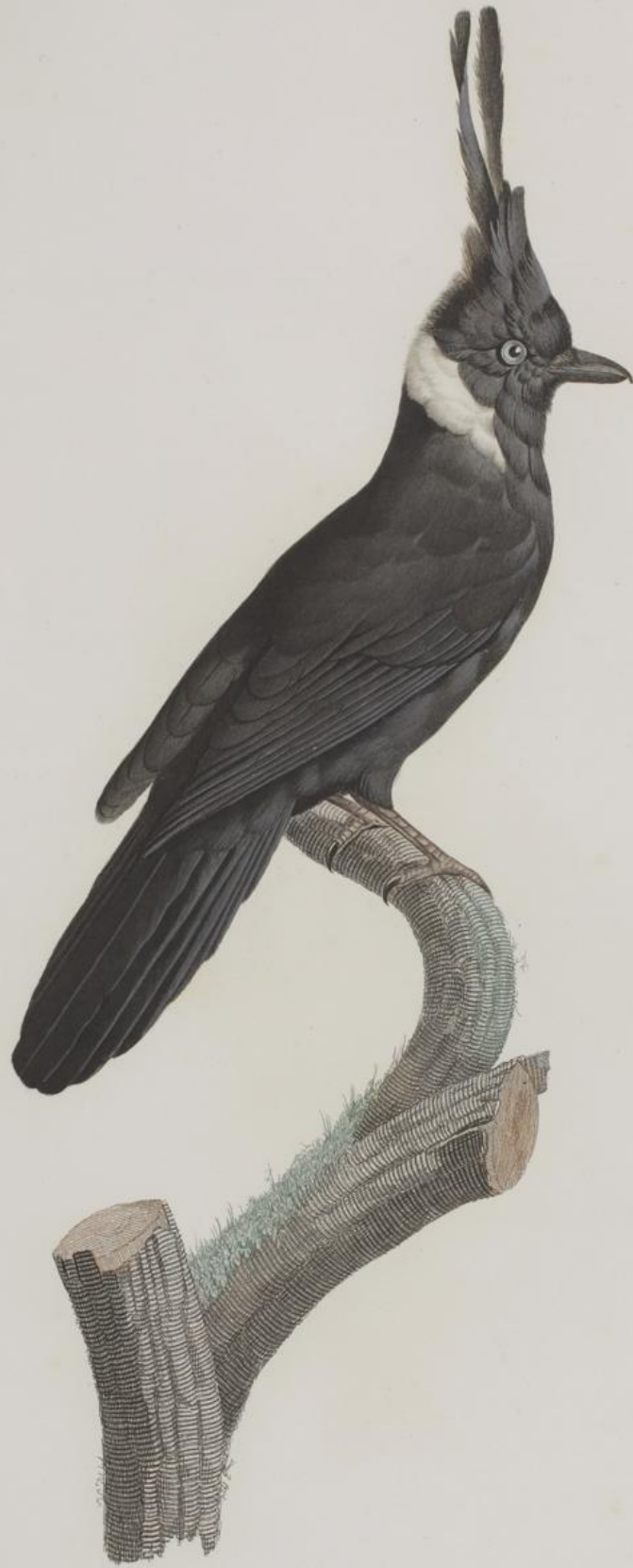
Le Geai Noir à Collier blanc. N o . 42.