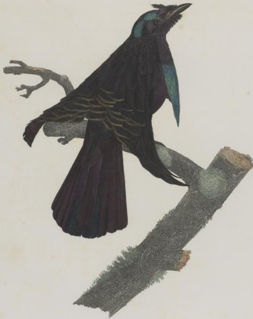
Le Superbe dans l'état du repos. N. 16.