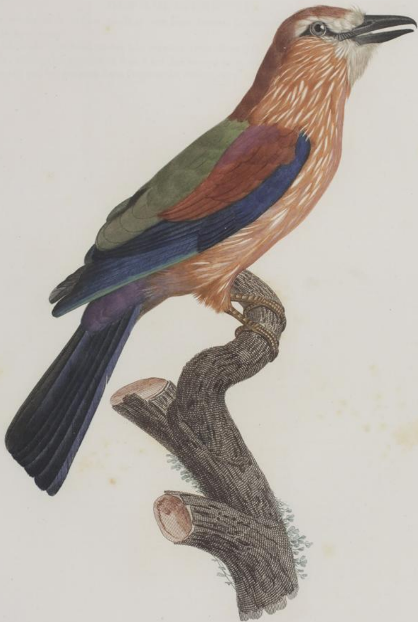
Le Rollier varié d'Afrique, jeune âge. N.º 29.