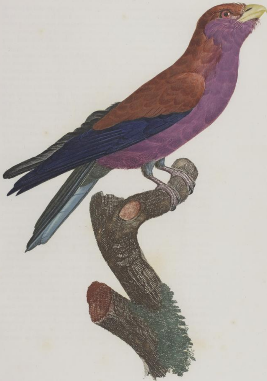
Le grand Rollet Violet . n. 34.