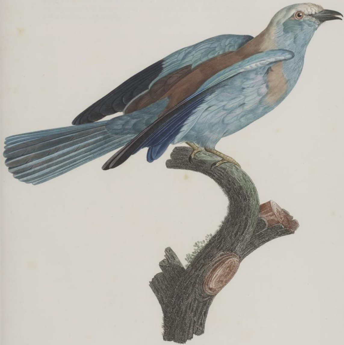
Le Rollier vulgaire, femelle. n° 33.