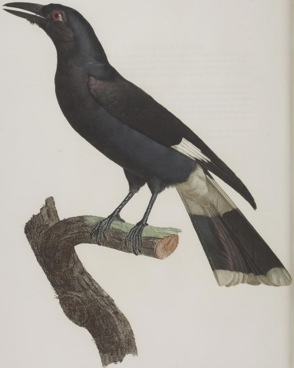
Le grand Calibé. n.º 24.