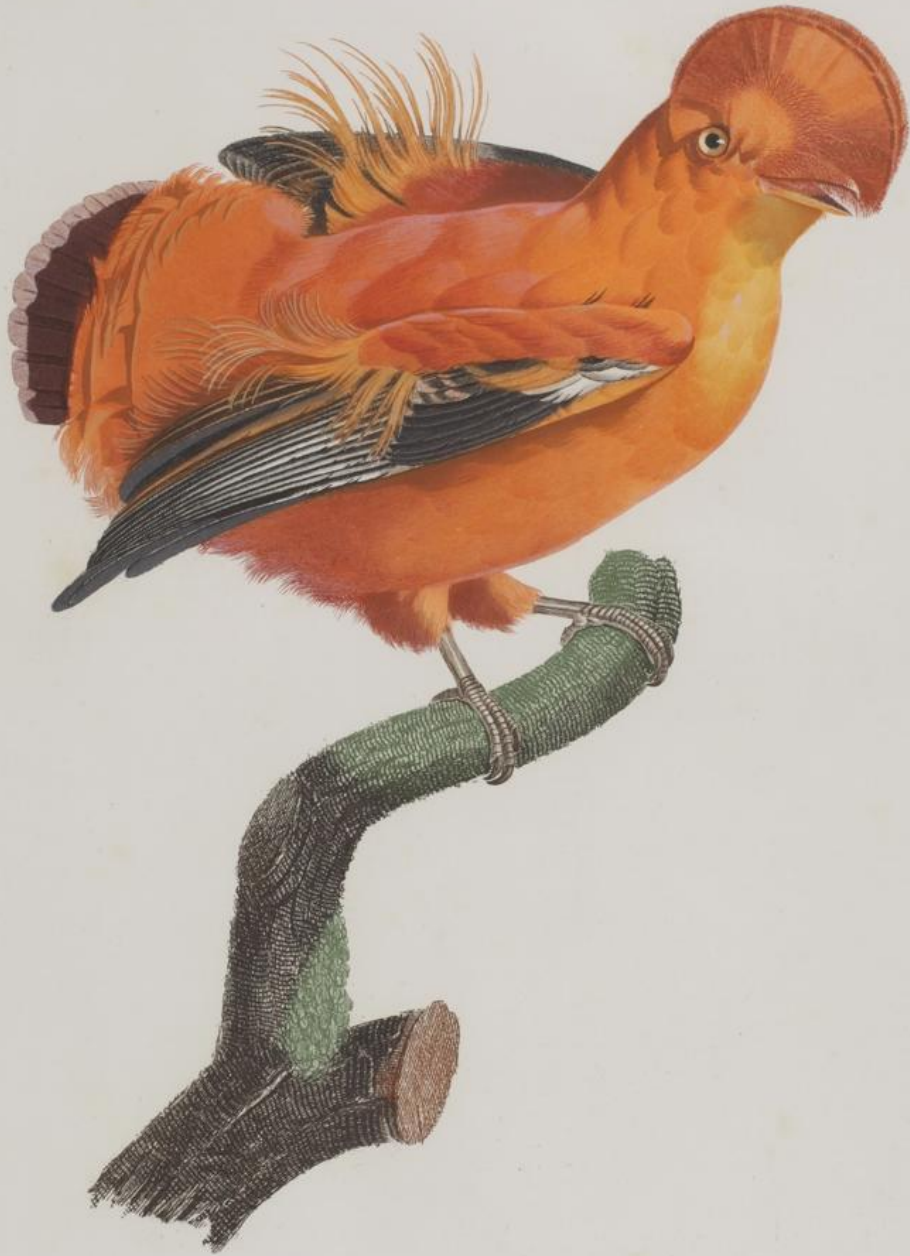
Le Coq de roche mâle. N. 51.