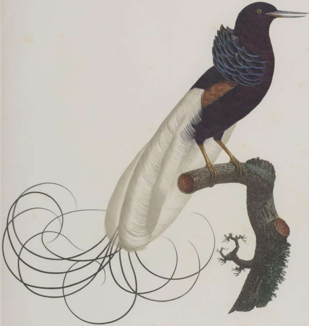
Le Nébuleux, dans l'état du repos. Pl. 17.