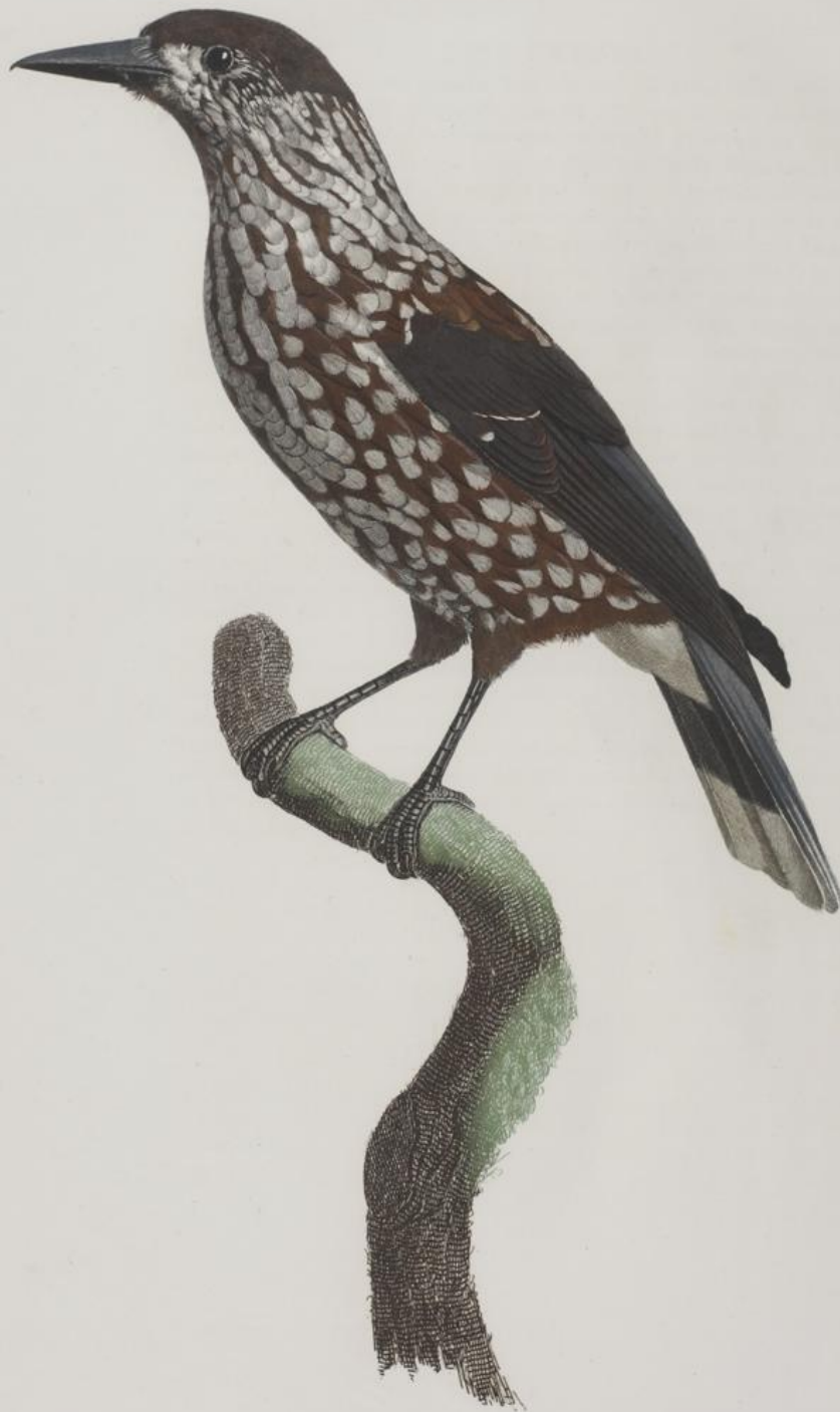
Le Casse noire. N. 55.