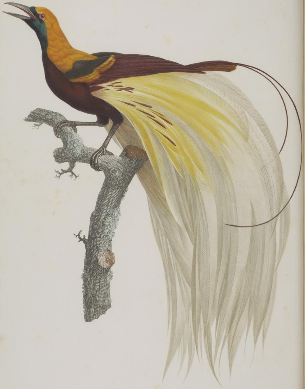
Le petit Oiseau de paradis Emeraude, mâle. n.º 4.