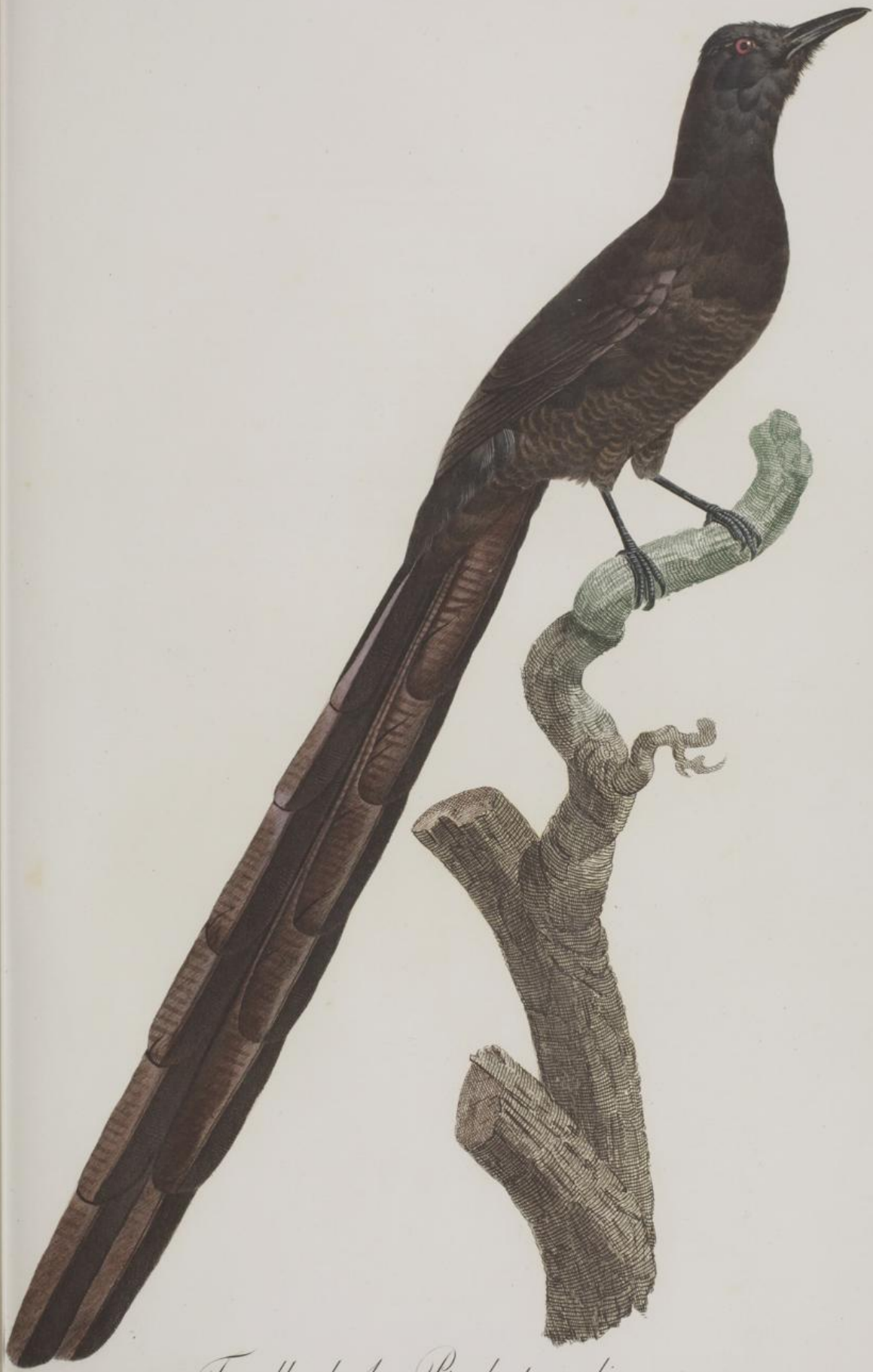
Femelle de la Pie de paradis. N. 22.