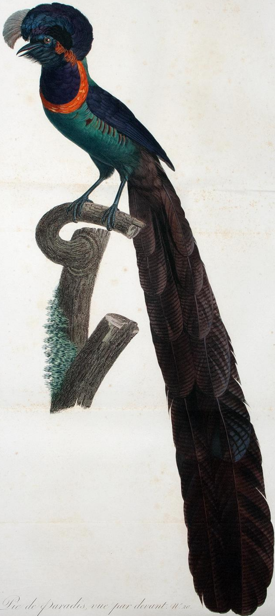
La Pie de paradis, vue par devant. N. 20.