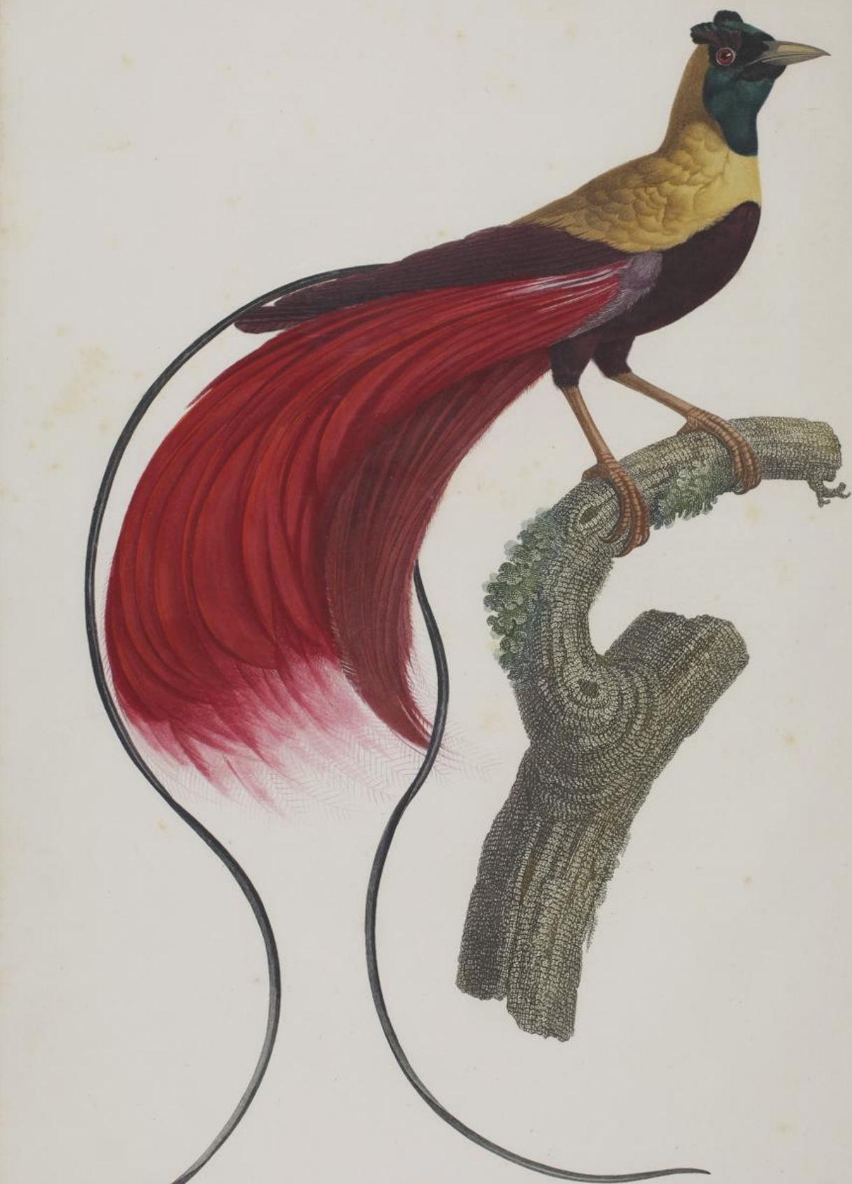
L'Oiseau de Paradis rouge. N. 6.