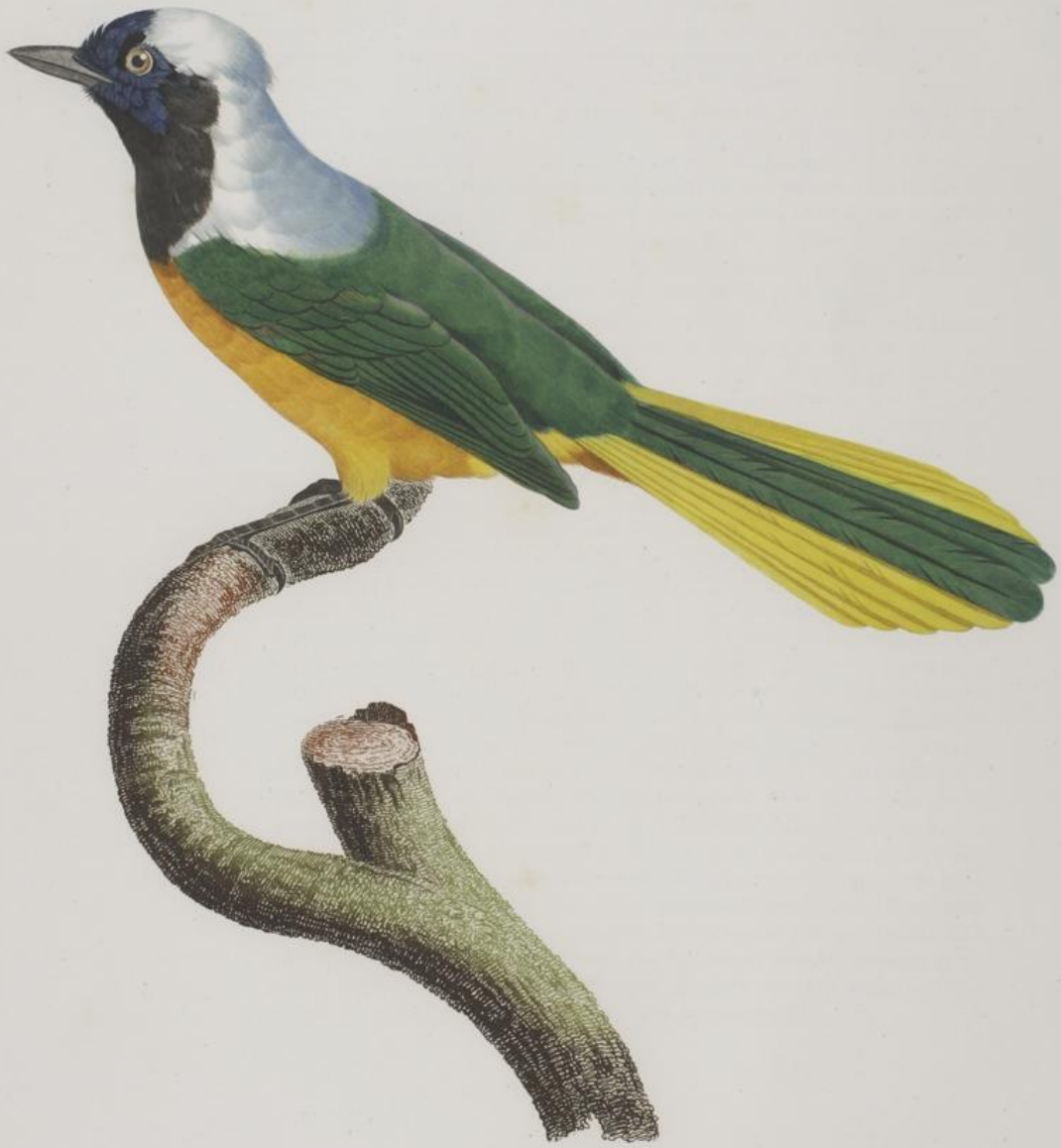
Le Gai Peruvien. n. 46.