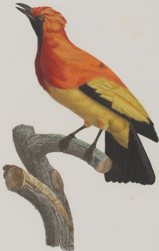
Le Loriot de paradis mâle. n. 18.