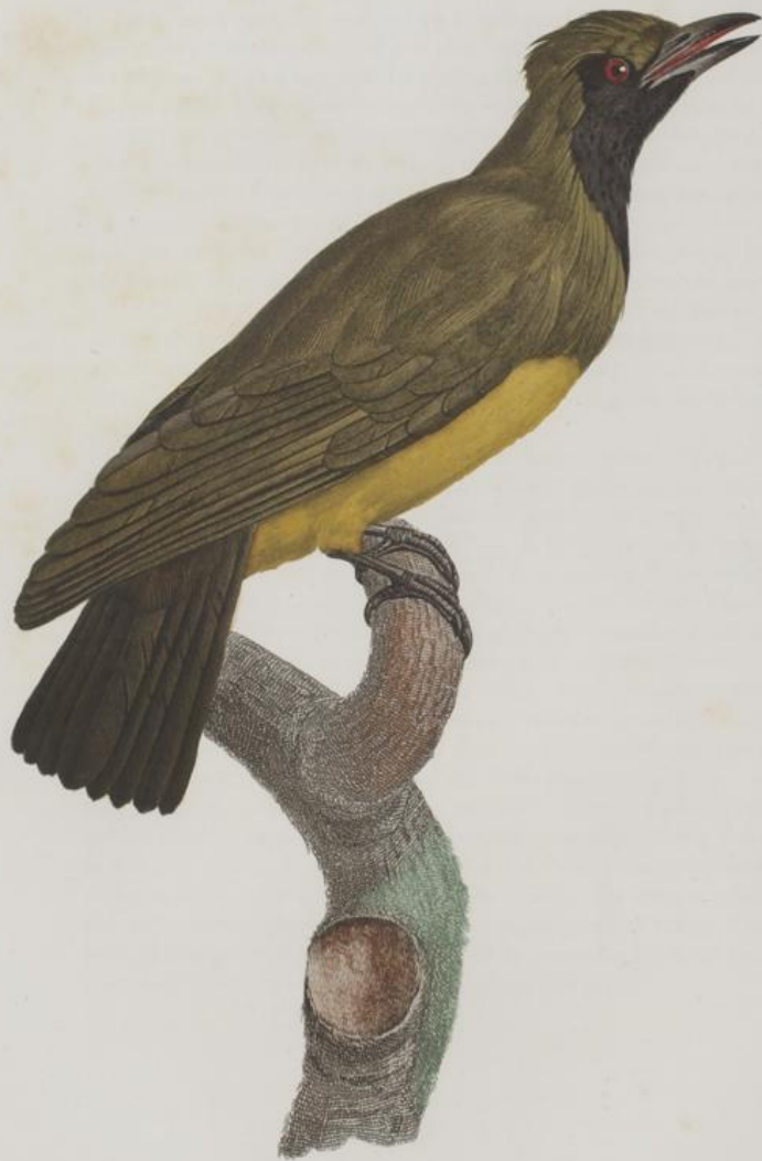
Le Loriot de paradis femelle. N.º 19.