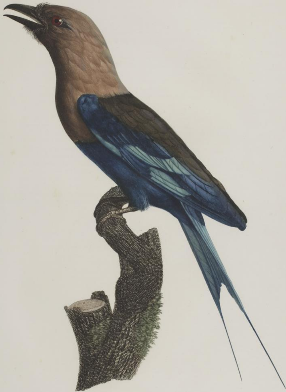
Le Rollier, à ventre bleu. N. 26.