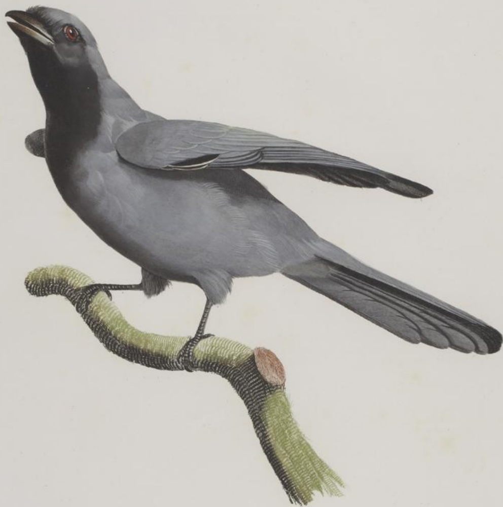
Le Rollier à masque noir. N.° 30.