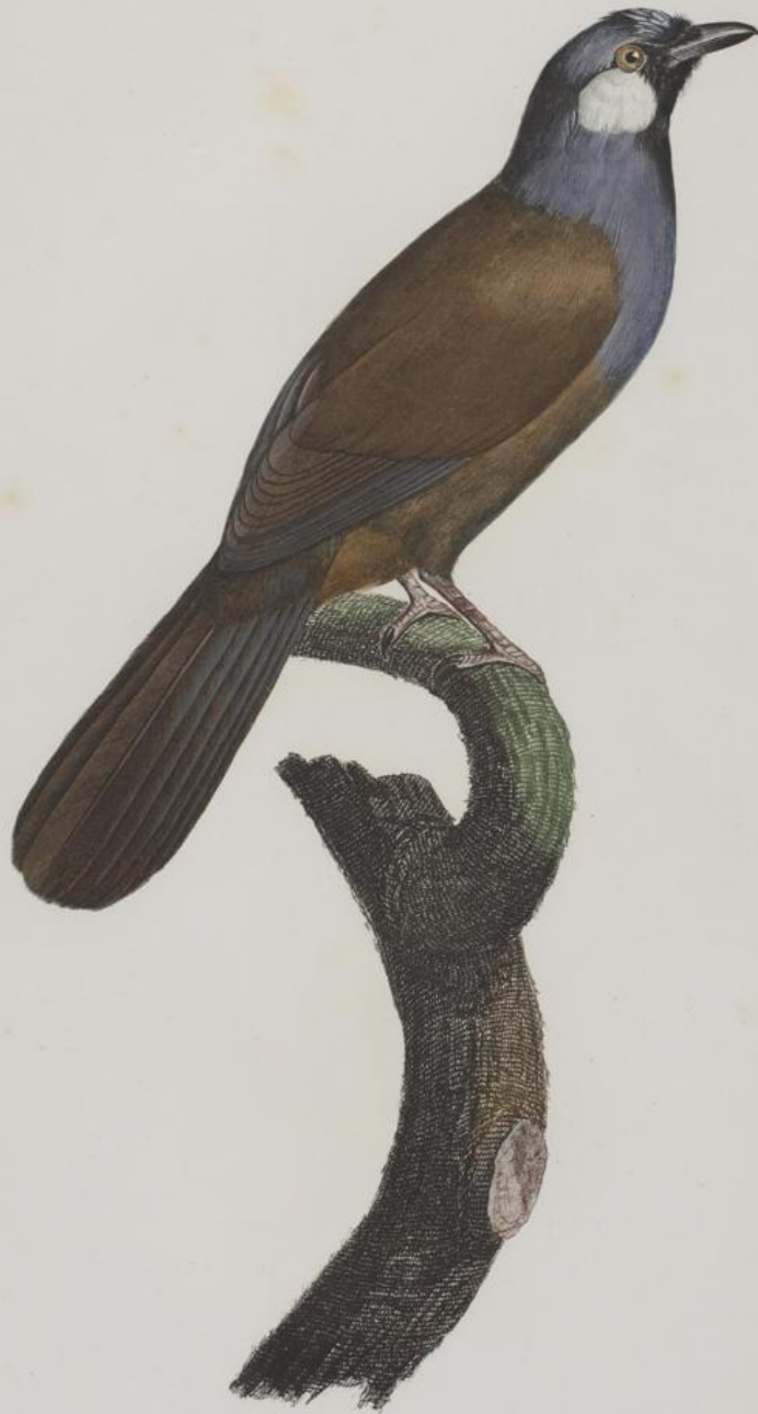
Le Geai à joues blanches. N.º 43.