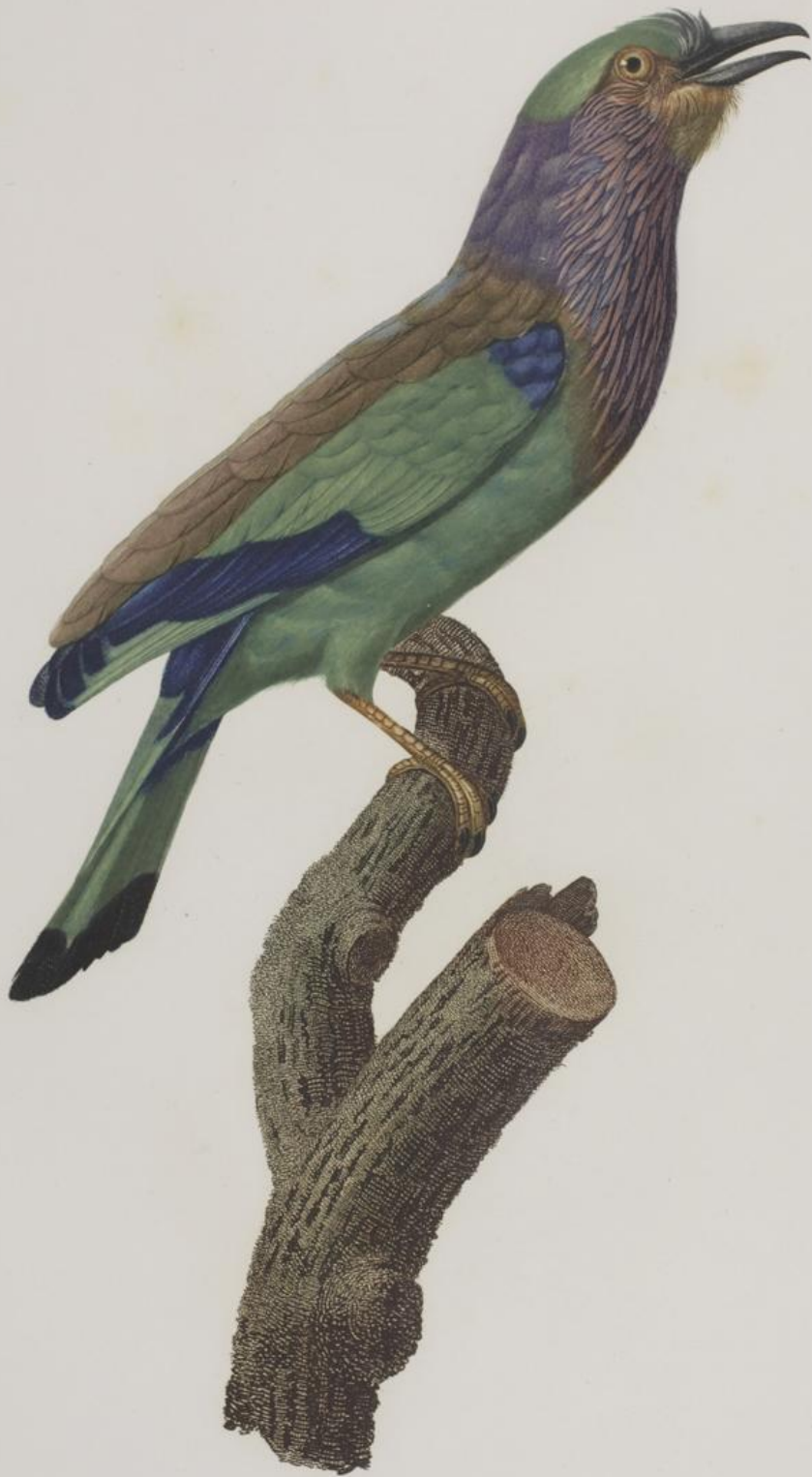
Le Poutier varié des Moluques. N.º 27.