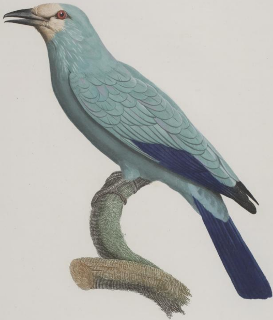
Le Rollier vert. n. 31.