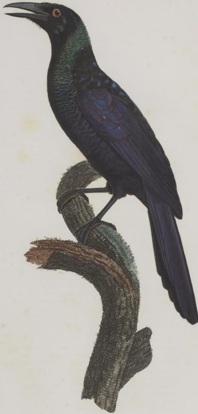
Le Calite mâle. n. 23.