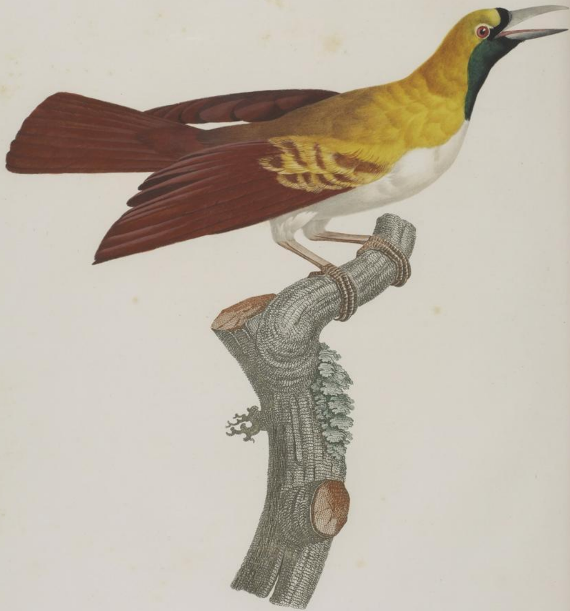
Femelle du petit Oiseau de paradis Emeraude. n.° 5.