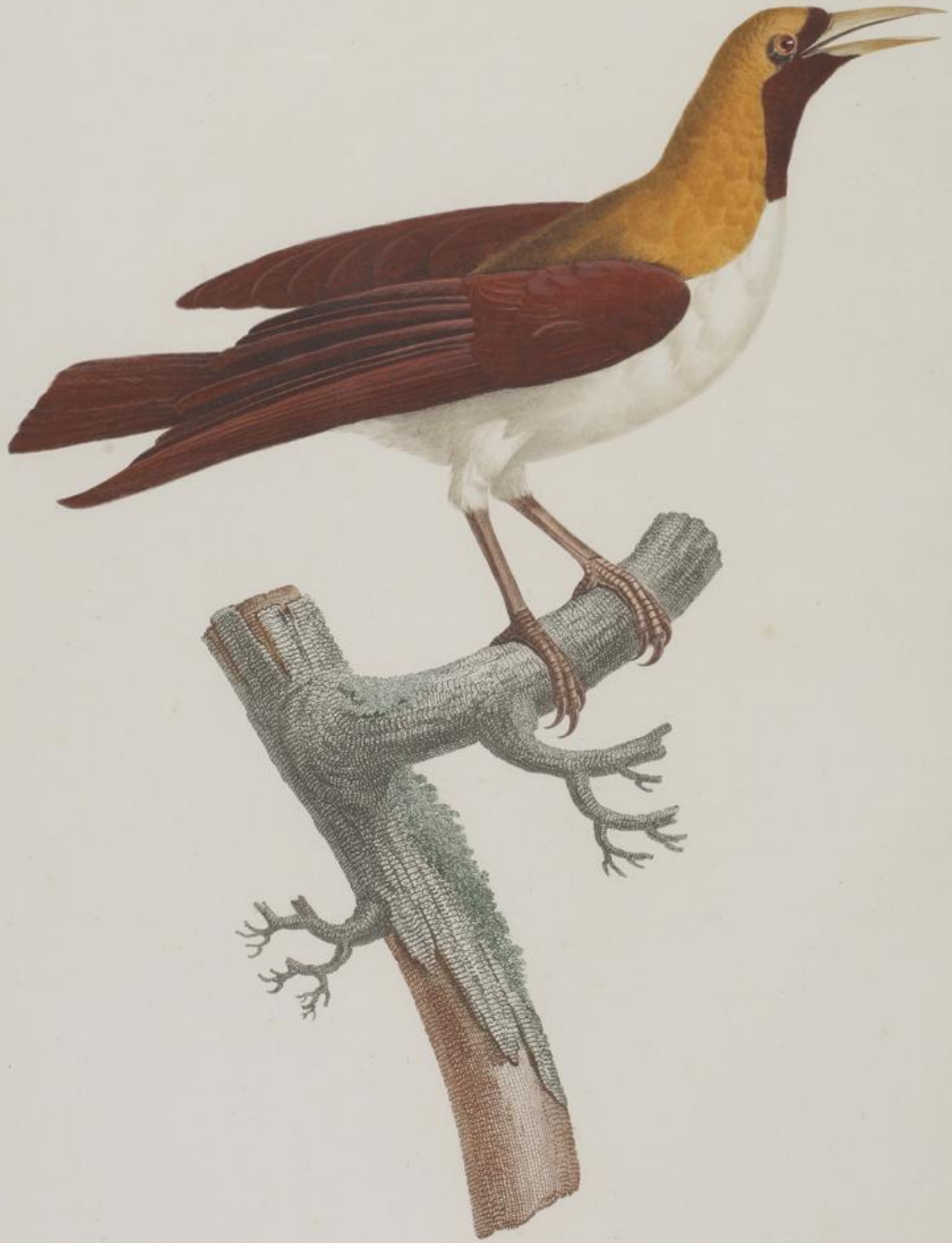
Femelle du grand Oiseau de paradis Emeraude. N. 2.