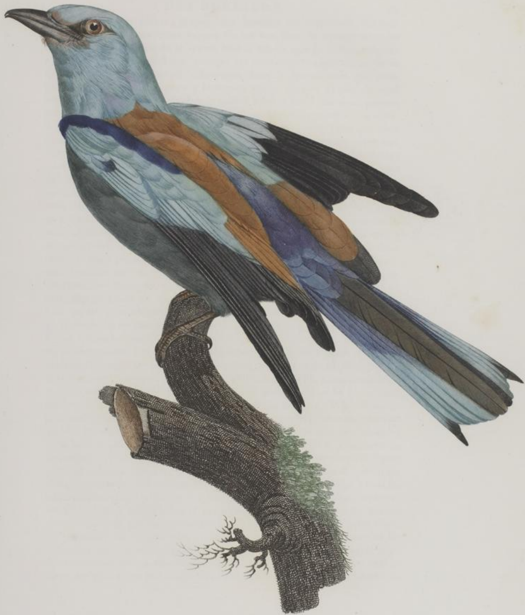
Le Rollier vulgaire, mâle. n.º 32.