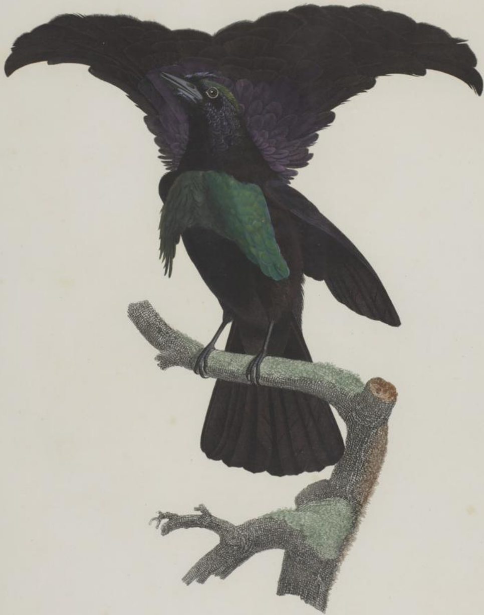
Le Superbe étalant ses parures. N. 15.