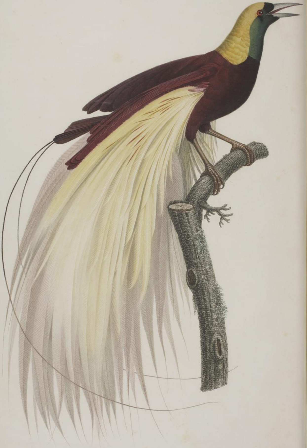
Le grand Oiseau de Paradis, émercaude, mâle. N. 1.