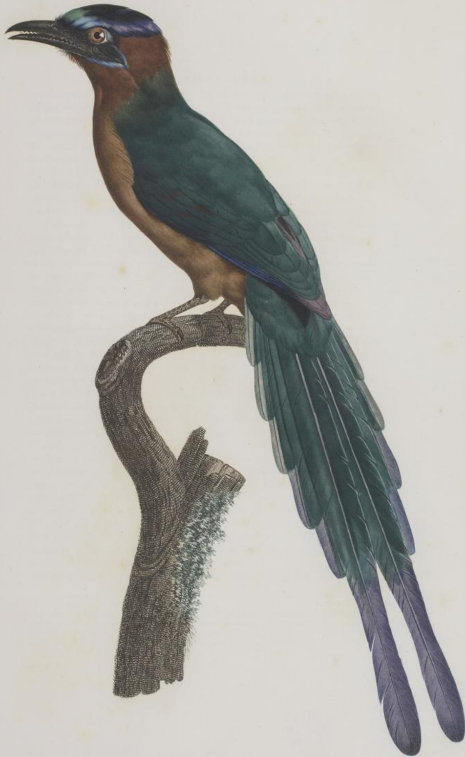
Le Motot dans son jeune âge. N. 38.