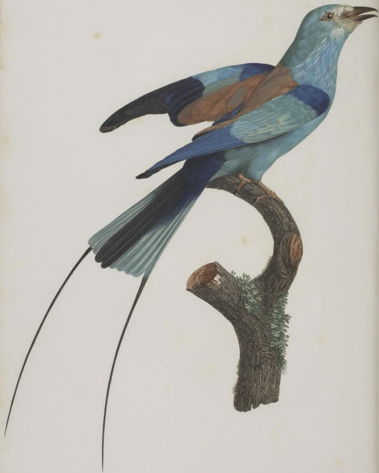
Le Rollier à long brins d'Afrique, mâle. n.º 25.