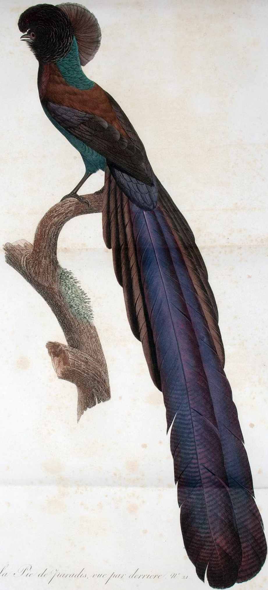
La Pie de paradis, vue par derrière. N° 21.