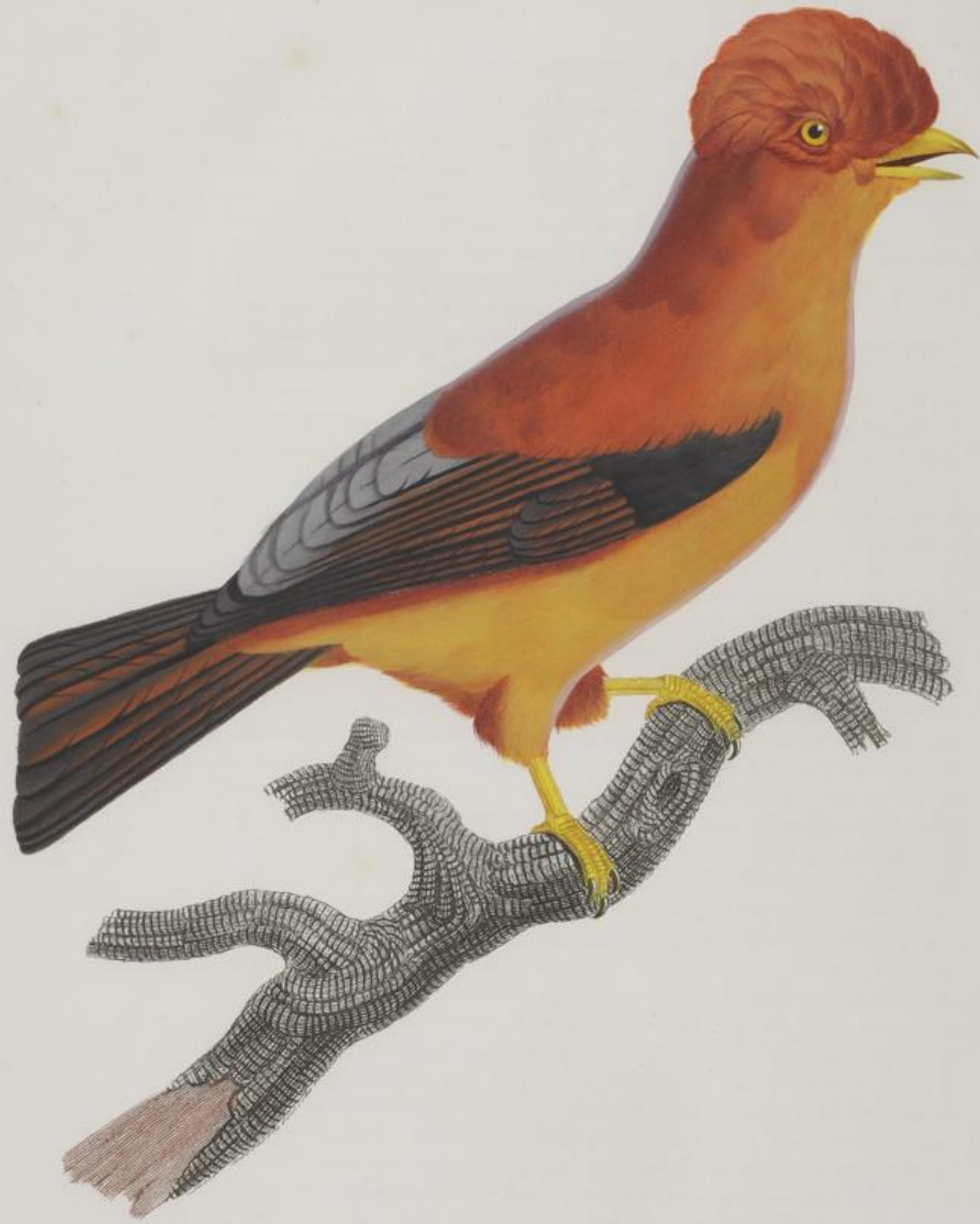
Le Cig de roche du Pérou. n. 54.