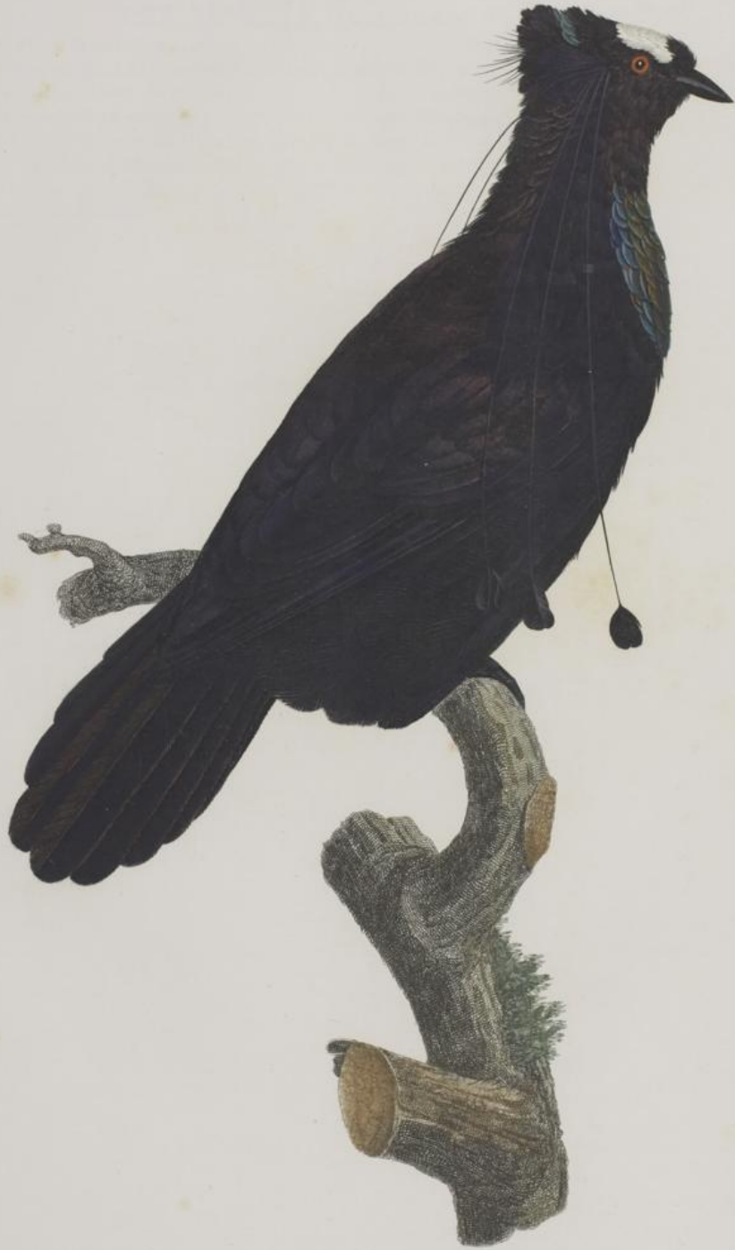
Le Sifilet dans l'état de repos. n.º 13.