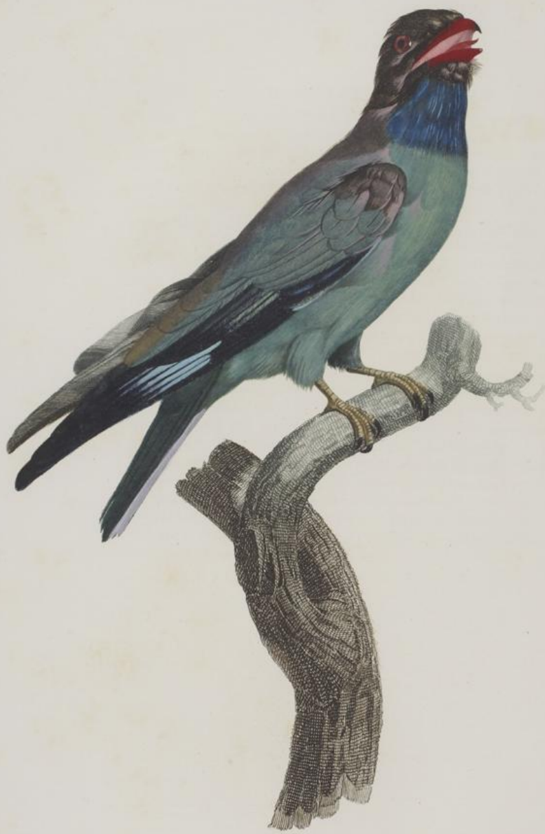
Le Rollet à gorge bleu. N. 56.